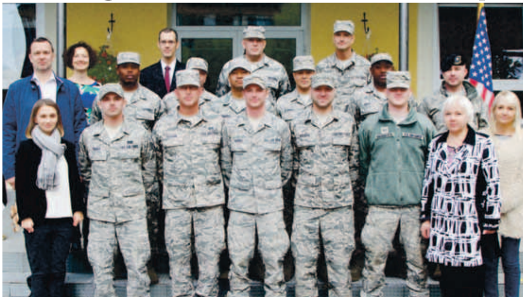
Ehitusel osalenud sõdurid koos saatkonna, lasteaia ja linna esindajatega.

Seekord oli töödeks aega planeeritud kaks nädalat, ning kui 14-liikmeline üksus 12. septembri hommikul Paldiskisse saabus, siis paari tunni jooksul tulid kohale ka eelnevalt tellitud materjalid, tööriistad ja seadmed. Kui selgus, et midagi on juurde vaja, siis oli võimalus-