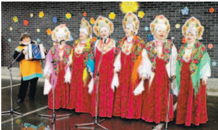
Выступали коллективы “Рябинушка” из Маарду, “Чары” и “Драго” из Таллинна.

вкусный суп, который помог согреть пришедших на праздник горожан. Также – коллективу поворов Русской Основной школы.