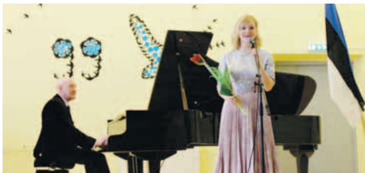
Музыканты начали с песни “Kodukotus”. Далее прозвучали как патриотические произведения, так и творчество Эхала. Концерт завершила композиция “Kus on kodu, mis on kodu?”.