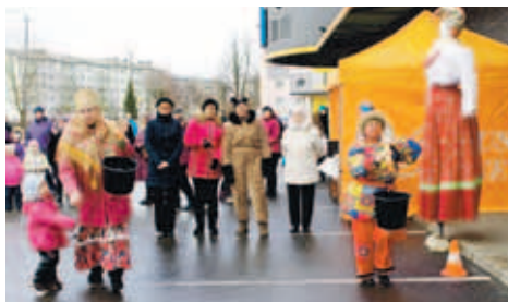
Многочисленных гостей праздника угощали в бесплатном масленичном кафе. Жители города могли поучаствовать в конкурсах.